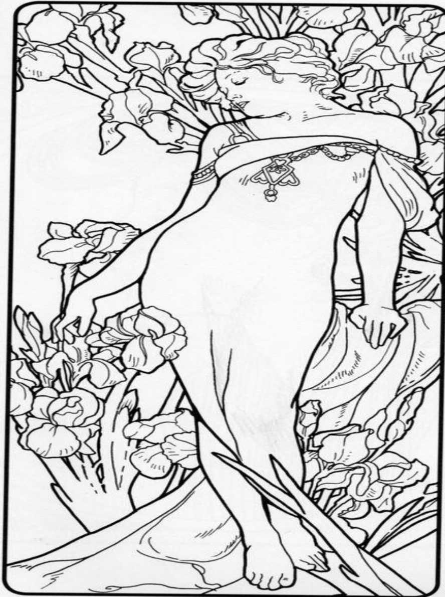
21. L'iris (Iris)