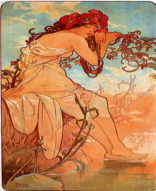
Verano de Alfons Mucha

Art nouveau es una corriente artística y cultural que busca romper con las tendencias dominantes del momento, modernizando el arte y la cultura urbana con un fuerte sentido decorativo, usa motivos inspirados en la naturaleza o materiales orgánicos para plasmar la sensualidad y el erotismo en objetos de arte decorativos, característicos de este movimiento. Art nouveau abarca los campos de la pintura, escultura, literatura, decoración, fotografía y diseño de joyas, muebles y objetos.