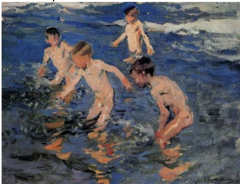
Baño de Joaquín Sorolla.

1.- ¿Qué Sentimiento o emoción te entrega esta pintura al momento de verla?