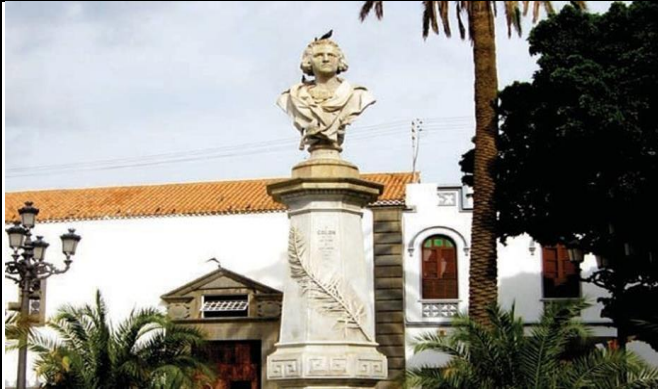
1 Vista general del monumento a Colón, Alameda, Las Palmas de Gran Canaria.

1.- Lee y observa atentamente las siguientes obras de arte.