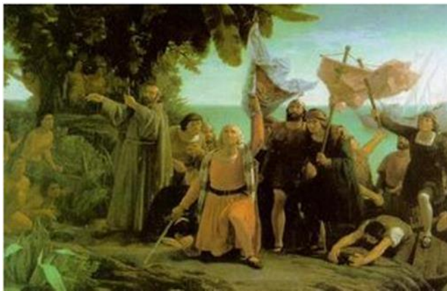
3 Primer desembarco de Cristóbal Colón en América, de Dióscoro Teófilo Puebla Tolín, Esta obra fue realizada en 1862. Es un óleo sobre lienzo.