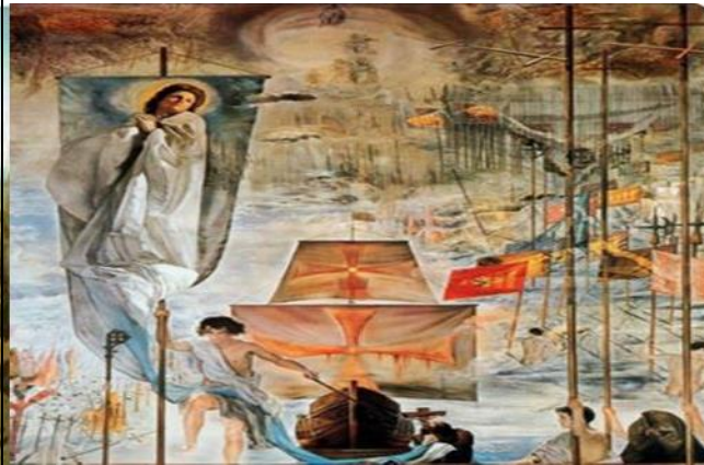
4 Descubrimiento de América - Pintura de Salvador Dalí 1959