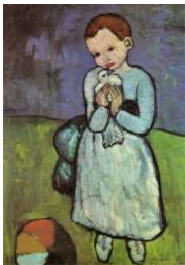
“Niño con paloma” Pablo Picasso

Formas no Figurativas: Son aquellas formas que no representan la realidad; también se las denomina abstractas. Es la interpretación que le da el propio autor a un objeto, paisaje, persona o sentimiento.