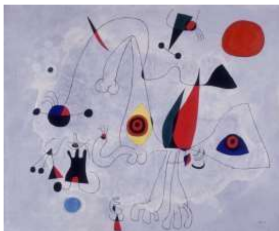
“Mujer y pájaro” Joan Miró