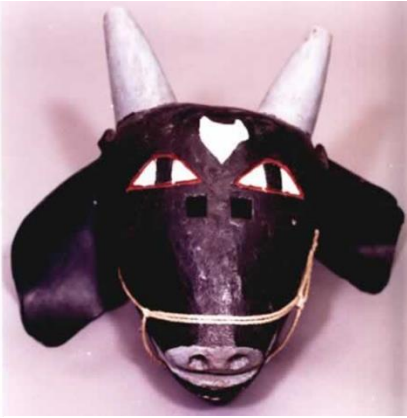
zoomorfos (rasgos animales)