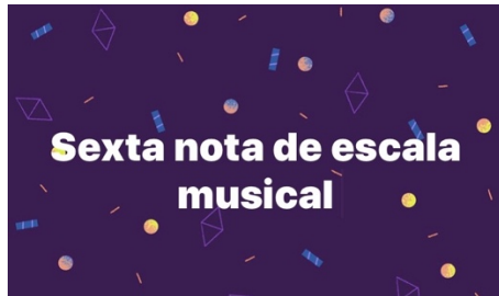
Imagen 2 corresponde a :