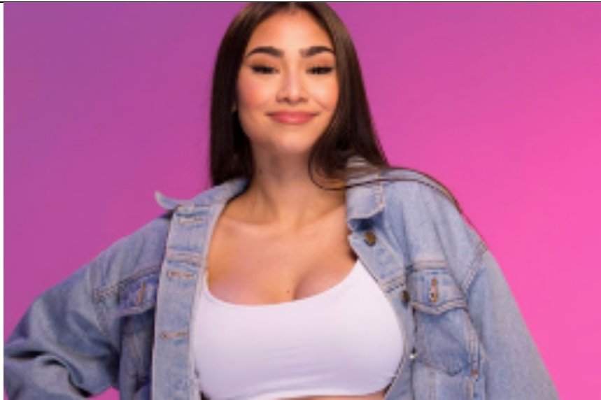
Imagen N°3 ¿ Que género musical desarrolla la artista nacional Paloma Mami ?