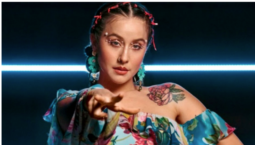
Imagen N 3, la cantante nacional Denise Rosenthal en que genero musical se destaca ?