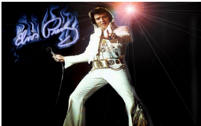
Imagen N°3, Elvis Presley en que genero musical se destaco ?