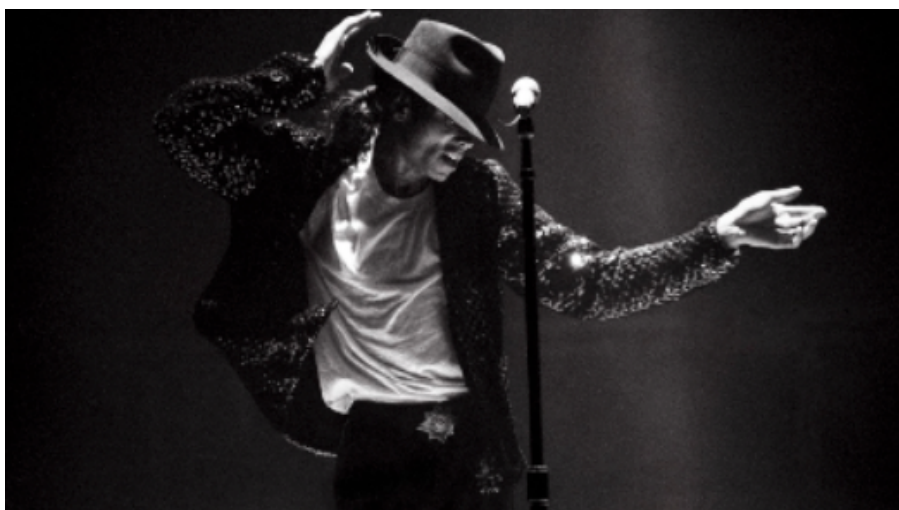
Imagen Nº 3

Imagen N°3, Denominado como el rey del genero musical pop :