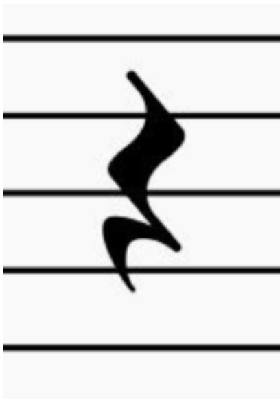
Imagen N°2 corresponde a :