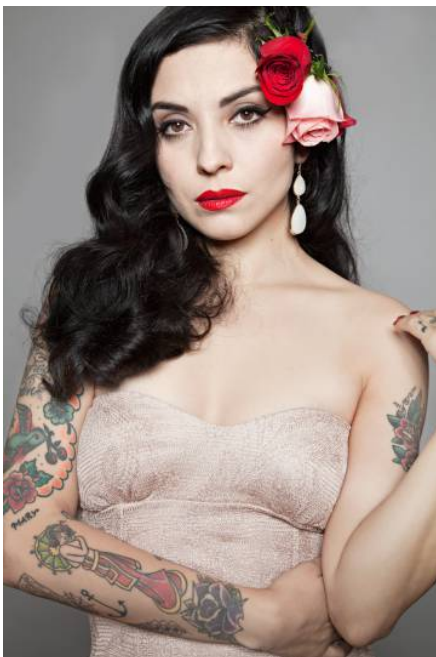
Imagen N°3 : Nombre de la cantante chilena que aparece en la imagen