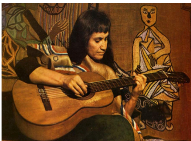
La imagen N°3 , Nombre de la cantautora chilena :