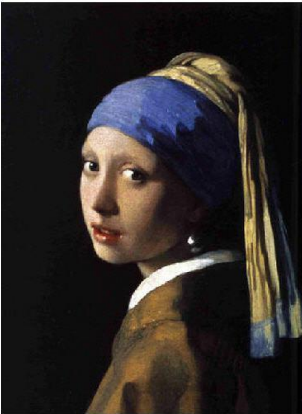
«La joven de la perla» Diego Velázquez