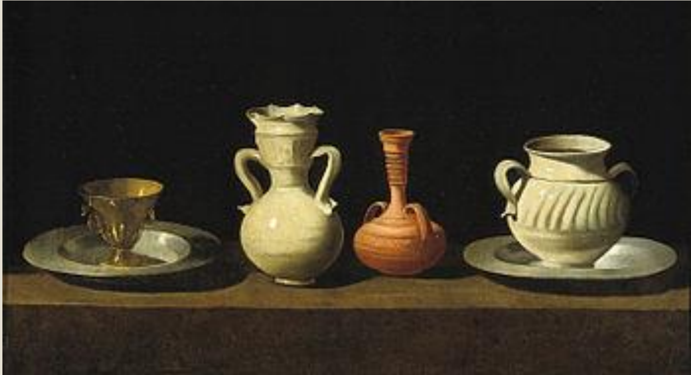
Francisco de Zurbarán: Bodegón con cacharros