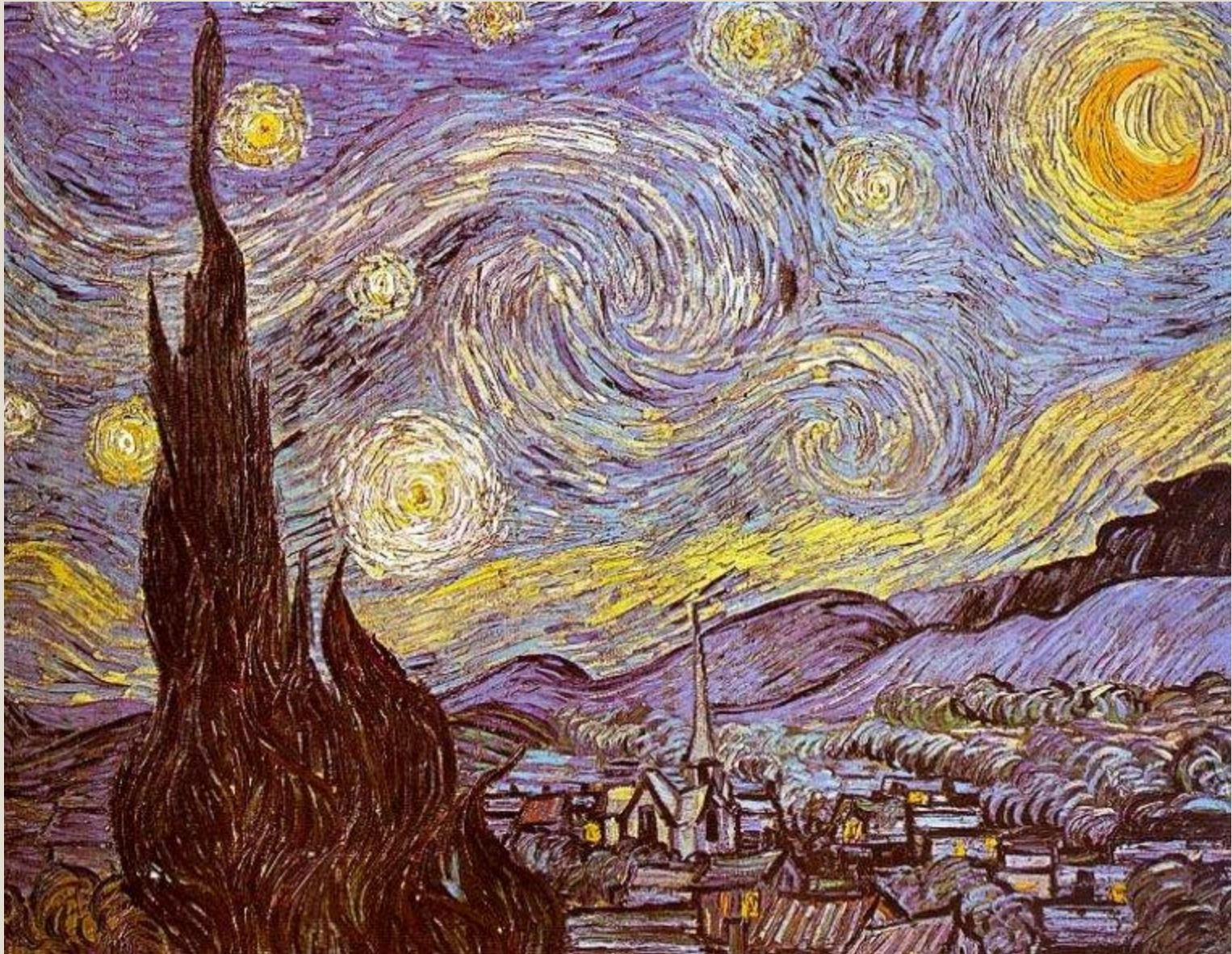
«Noche estrellada» Van Gogh