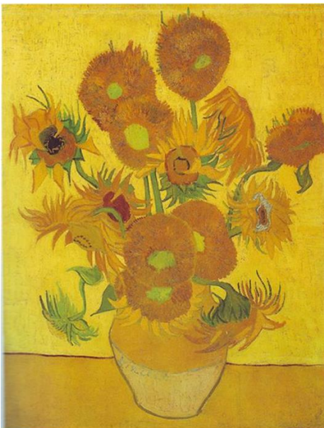
Girasoles de Vincent Van Gogh