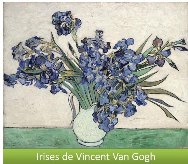
Irises de Vincent Van Gogh

I. Explica las sensaciones y emociones que te producen el color de estas obras: