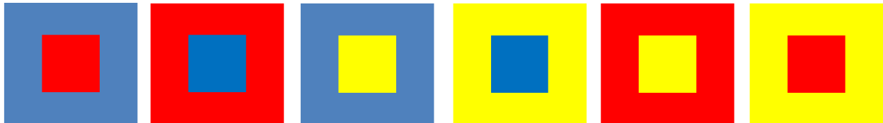
Contrastes entre colores primarios

II. Dibuje en su cuaderno los siguientes contrastes de colores: