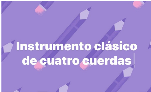
Imagen N° 2 corresponde a :