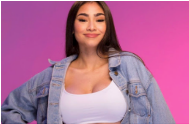
Imagen N°2 ¿ Que género musical desarrolla la artista nacional Paloma Mami ?