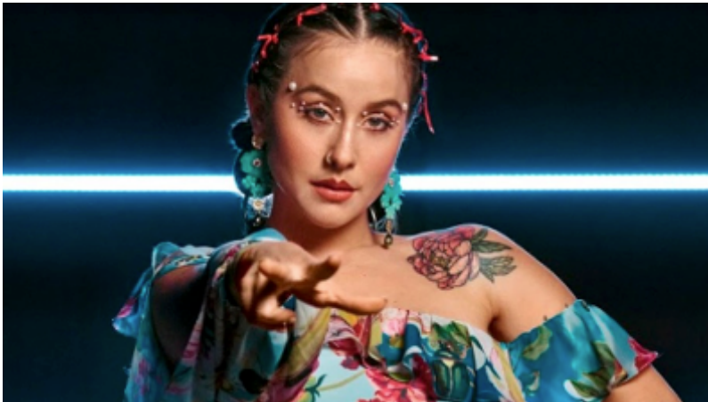
Imagen N° 3, la cantante nacional Denise Rosenthal en que genero musical se destaca ?