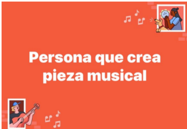
Imagen N° 2 corresponde a: