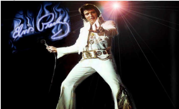
Imagen N°3, Elvis Presley en que genero musical se destaco ?