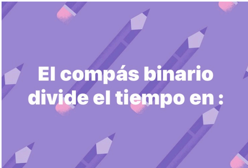
Imagen N° 2 corresponde a: