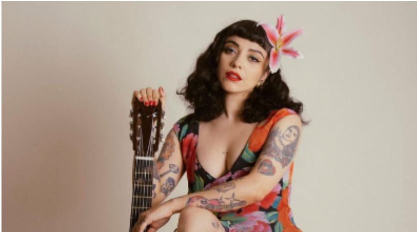
Imagen N3 : Nombre de la cantante chilena que aparece en la imagen