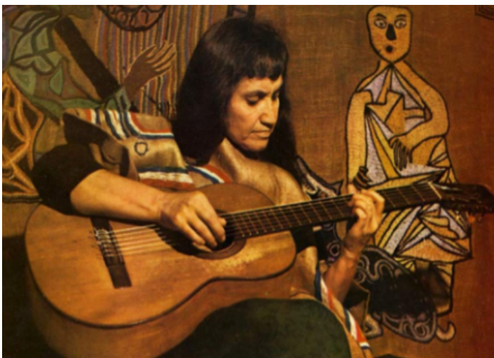
Imagen N° 3

La imagen N°3 , Nombre de la cantautora chilena :