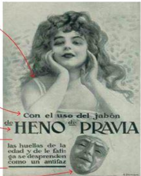
Imagen secundaria: la máscara refuerza la idea de dejar atrás la vejez y la fatiga anunciada en el eslogan.

Eslogan: frase breve y directa que declara los beneficios y ventajas del producto.