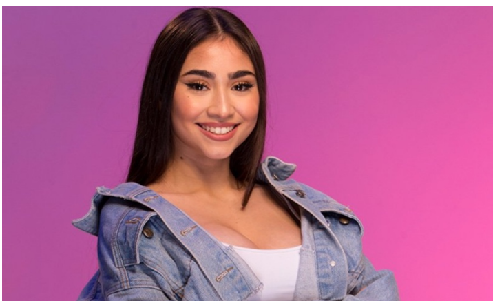
Imagen N° 3

La imagen N°3 ¿ Que género musical desarrolla la artista nacional Paloma Mami ?