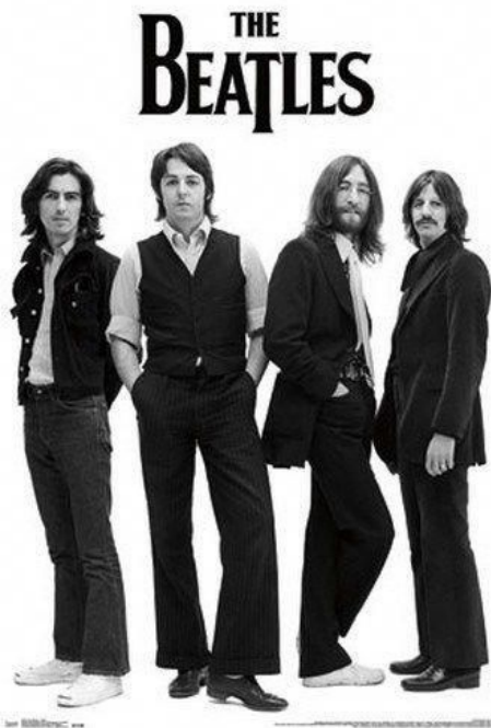
Imagen N° 3

La imagen N°3 ¿ Nacionalidad de esta banda icono de los años 60 ?