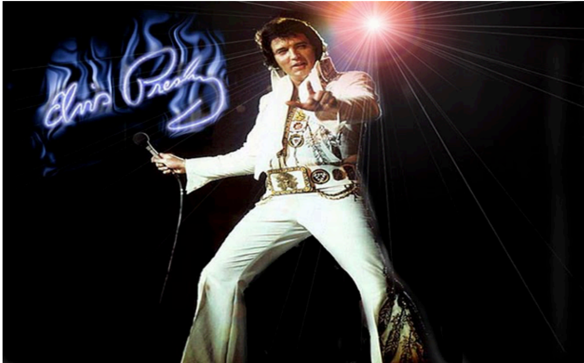
Imagen N° 3

Imagen N°3, Elvis Presley en que genero musical se destaco ?