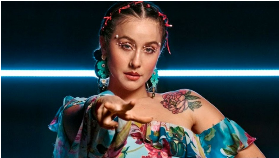
Imagen N°3, La cantante nacional Denise Rosenthal en que genero musical se destaca ?