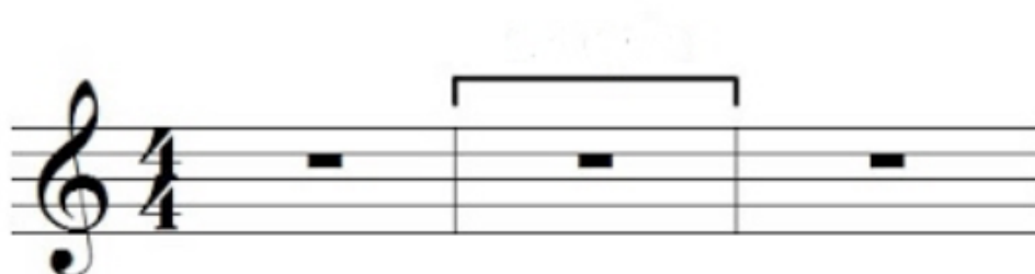
Imagen No 2 : ¿Cuál es el nombre del espacio divisor del un pentagrama ?