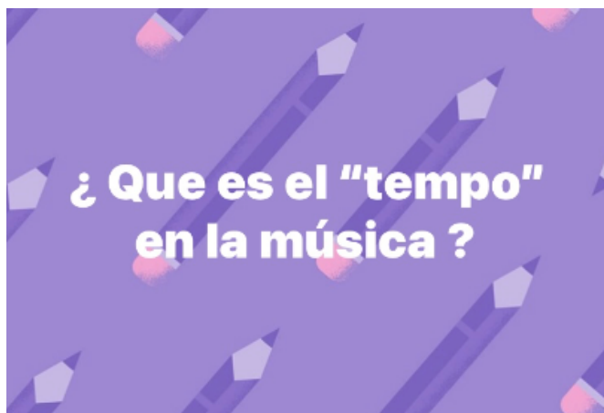
Imagen N 2 corresponde a :