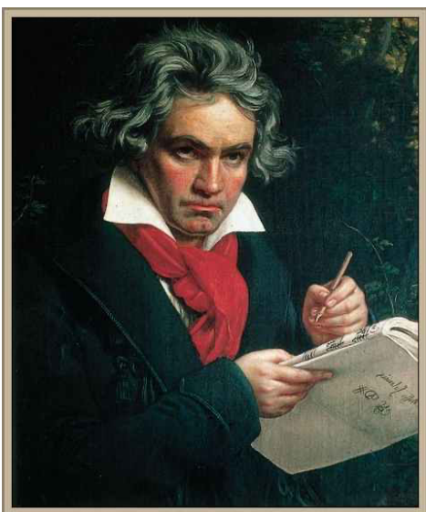
Imagen N°3 : Nombre de este extraordinario músico , que perdió la audición producto una enfermedad llamada TINNITUS