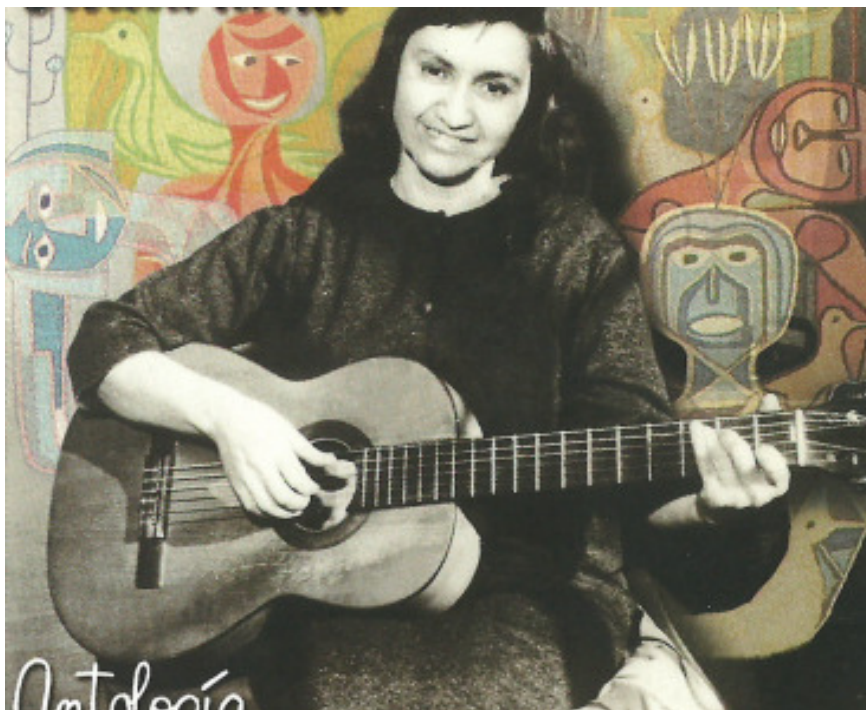
Imagen N° 3