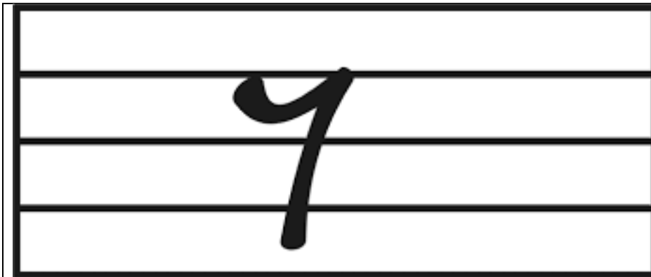
Imagen N°2 corresponde a: