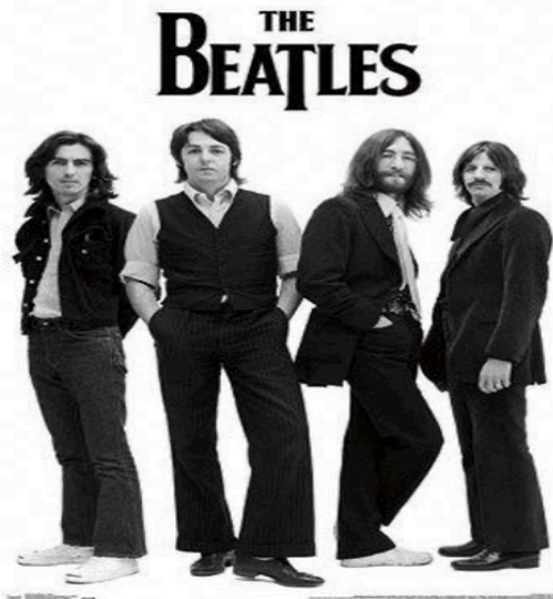
Imagen N° 3

La imagen N°3 ¿ Nacionalidad de esta banda icono de los años 60 ?