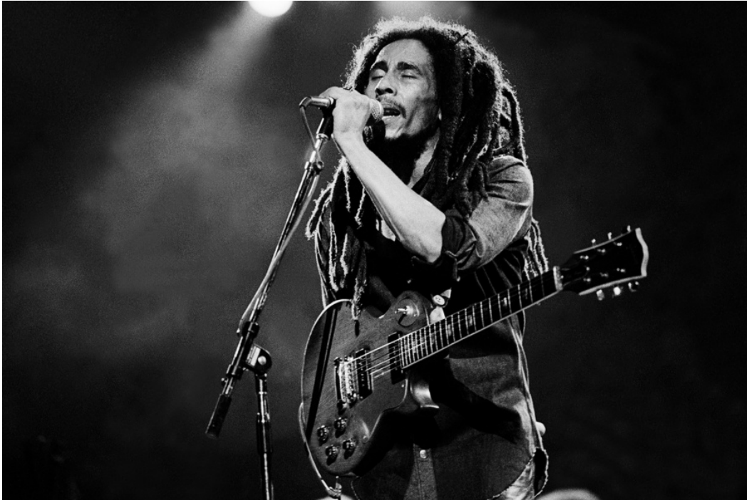
Imagen N° 3

La imagen N°3 ¿ Con qué género musical era conocido mundialmente el músico Bob Marley ?