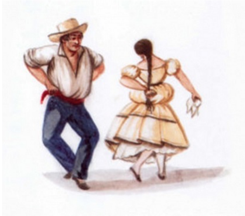
Imagen N° 3

De acuerdo a la imagen, ¿ Qué representa el baile zamacueca ?