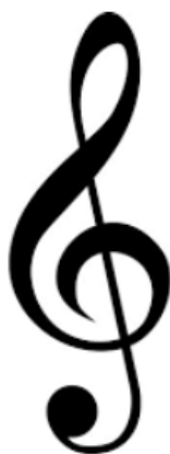
Imagen N°2 : se clasifica como una :