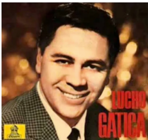
Imagen N° 3

¿ Con qué género musical el chileno Luis Gatica, era conocido mundialmente como el rey en los años 50 ?