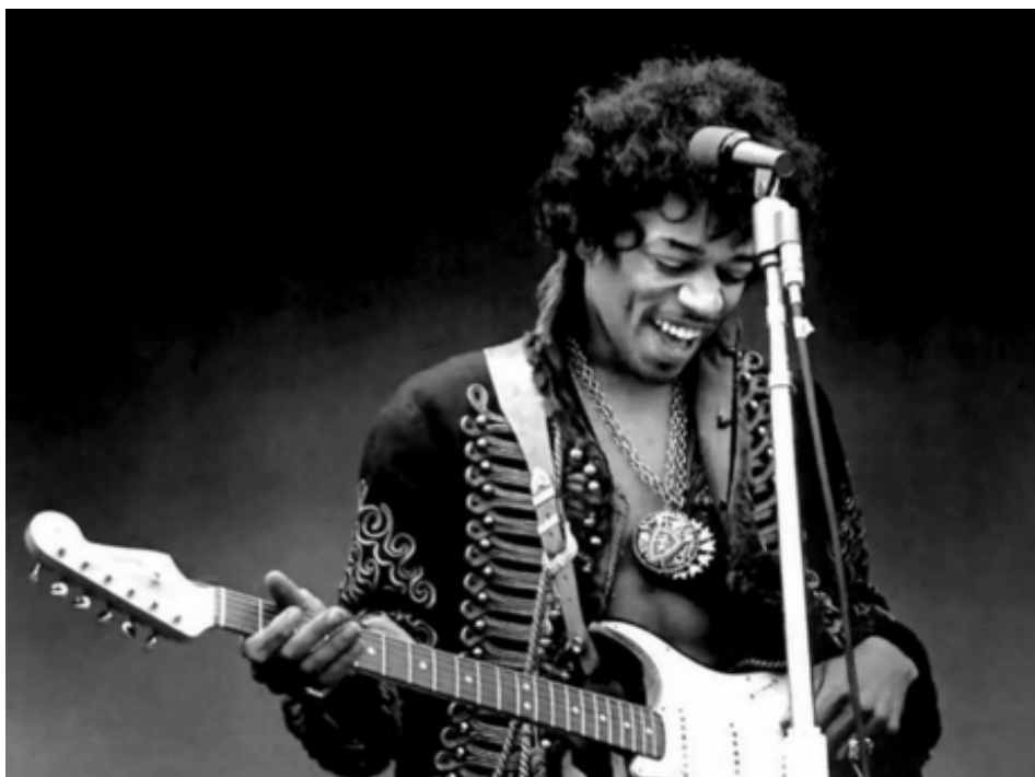
Imagen N3 : ¿ Nombre de él extraordinario guitarrista de los años 60, catalogado como uno de los mejores del mundo en el genero musical ROCK ?