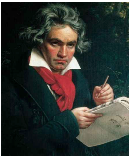
Imagen N 3 : Nombre de este extraordinario música , que perdió la audición producto una enfermedad llamada TINNITUS