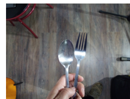
Cuchara y tenedor

2) Con una cinta adhesiva pega el papel en el lado izquierdo del cojín