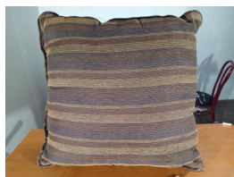
Cojín o almohada

1) Para participar del siguiente desafío deberás tener a la mano: