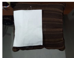
Cojín con hoja pegada