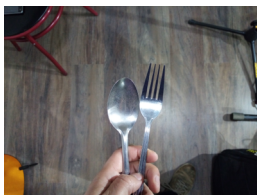
Cuchara y tenedor